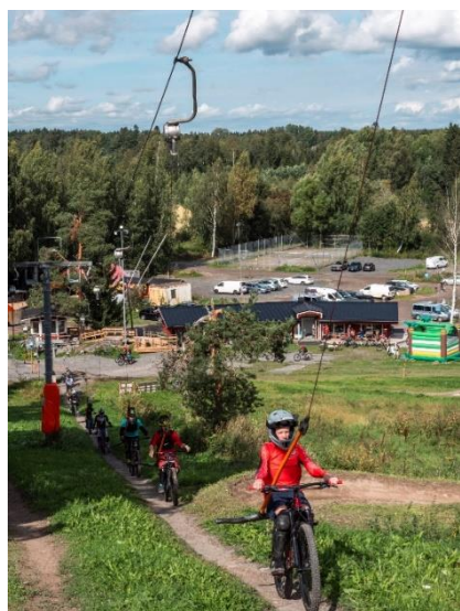
Maastopyöräily viikonloppu Ruosniemi Bike Fest