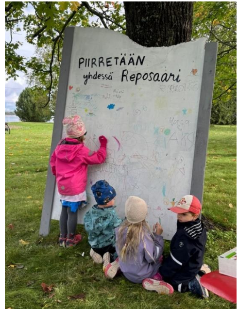
Satamapuisto soi ja tanssii (Räpsöön puuhapäivä)