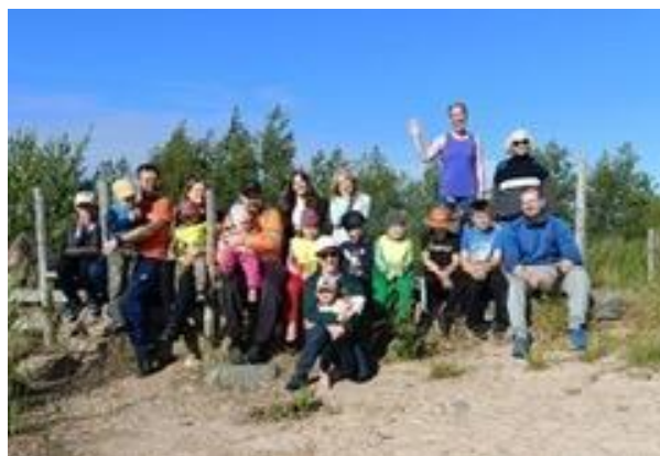
Preiviikin kiri pyöräilee