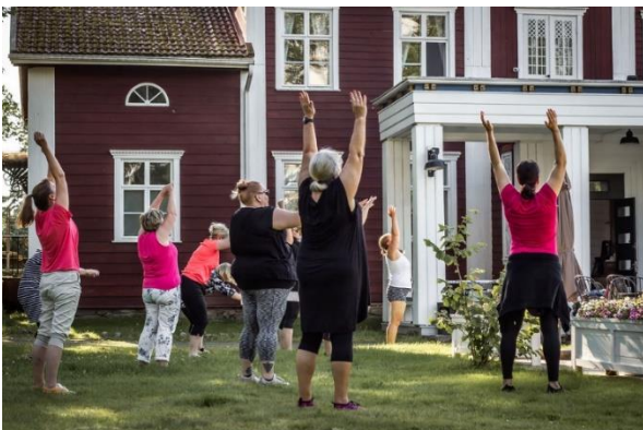
Koe Kellahti kaikin aistein