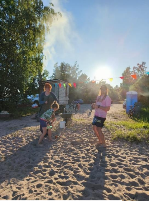
Musaa Räpsöön rannalla