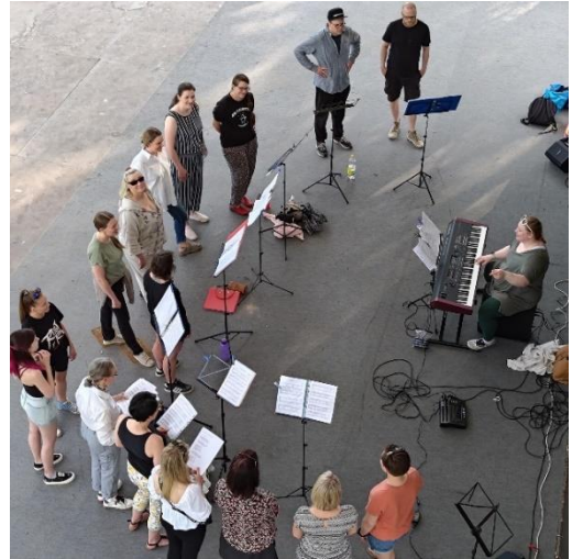
Kuoro x Sirkus