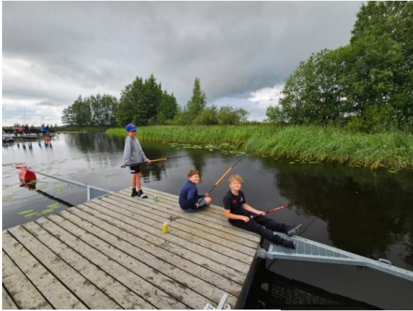
Iloinen onkiehtoo Metsämaalla