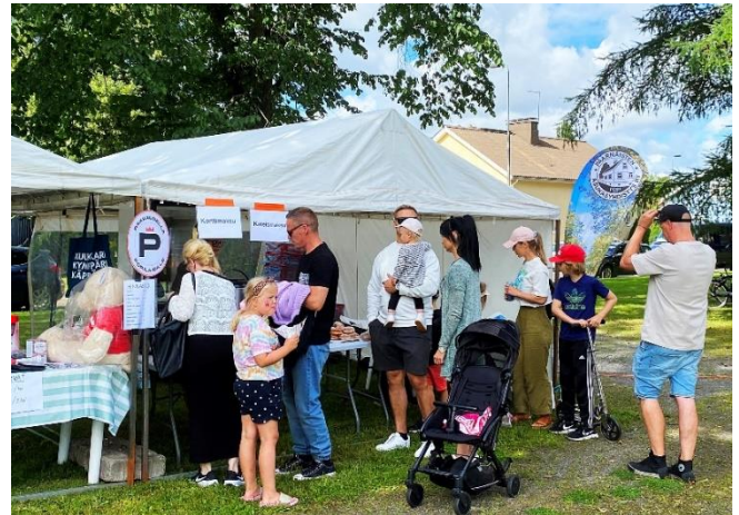
Päärnäisten ulkotapahtumat 2024