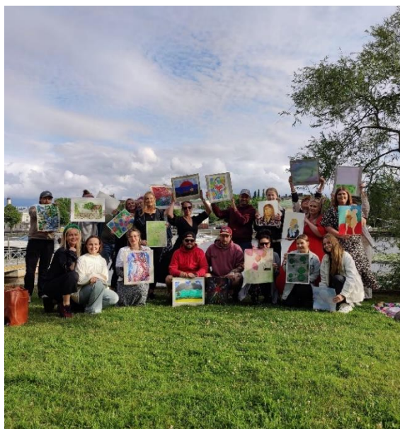
Luovuuden virtaa Luodolla