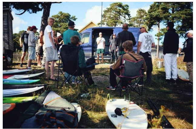
Laineil – kokeil lainelautailuu ja koe porilaist surffikulttuurii