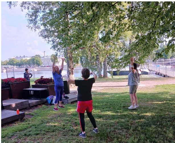
Vartalot toimimaan naurun kera ja hyvä mieli liikunnalla