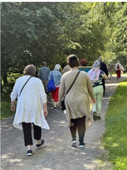
Porin virkistyspäivät, ulkoilmassa yhdessä