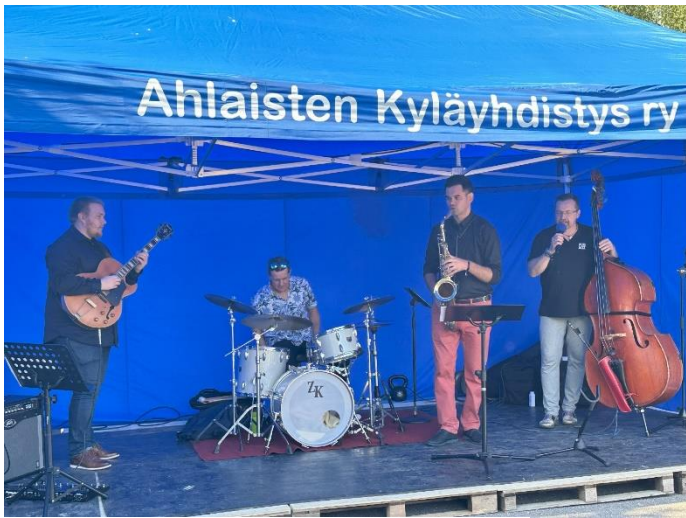
Torilla tavataan – Ahlaisten tapahtumakesä